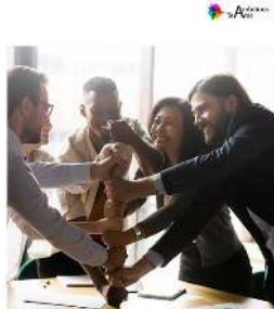
Skabelse af high performing teams