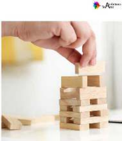
Vi skaber selv en positiv vinderkultur

I Ambitious Teams indarbejder vi psykologisk forskning i inspirerende workshopdage, så alle går stærkt motiverede derfra med brugbare værktøjer i bagagen.